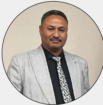
محمد حسن إنتاج الأسمدة العضوية من المخلفات العضوية الصلبة المنزلية والزراعية