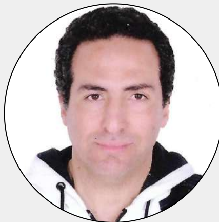
أحمد شوقي جاد اكسرجي للتدفئة النظيفة لمزارع الدواجن