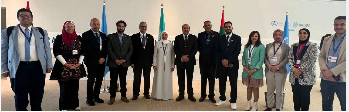
سعادة السفير هشام بدر يلتقي بمعالي الوزيرة عهد الرومي

أسفر الاجتماع مع معالي الوزيرة عهد الرومي، وزيرة الدولة لشؤون التطوير الحكومي والمستقبل بدولة الامارات العربية المتحدة، عن دراسة التعاون و تحقيق التبادل المعرفي بين البلدين فيما يخص نقل تجربة المبادرة الوطنية للمشروعات الخضراء الذكية لتطبيقها بالإمارات. و استعداد معاليها لتشبيك المشروعات الفائزة بمختلف القطاعات مع مستثمرين بدولة الإمارات. ودعم المبادرة في التعاون مع عدد من الصناديق الاستثمارية للمشروعات الخضراء.